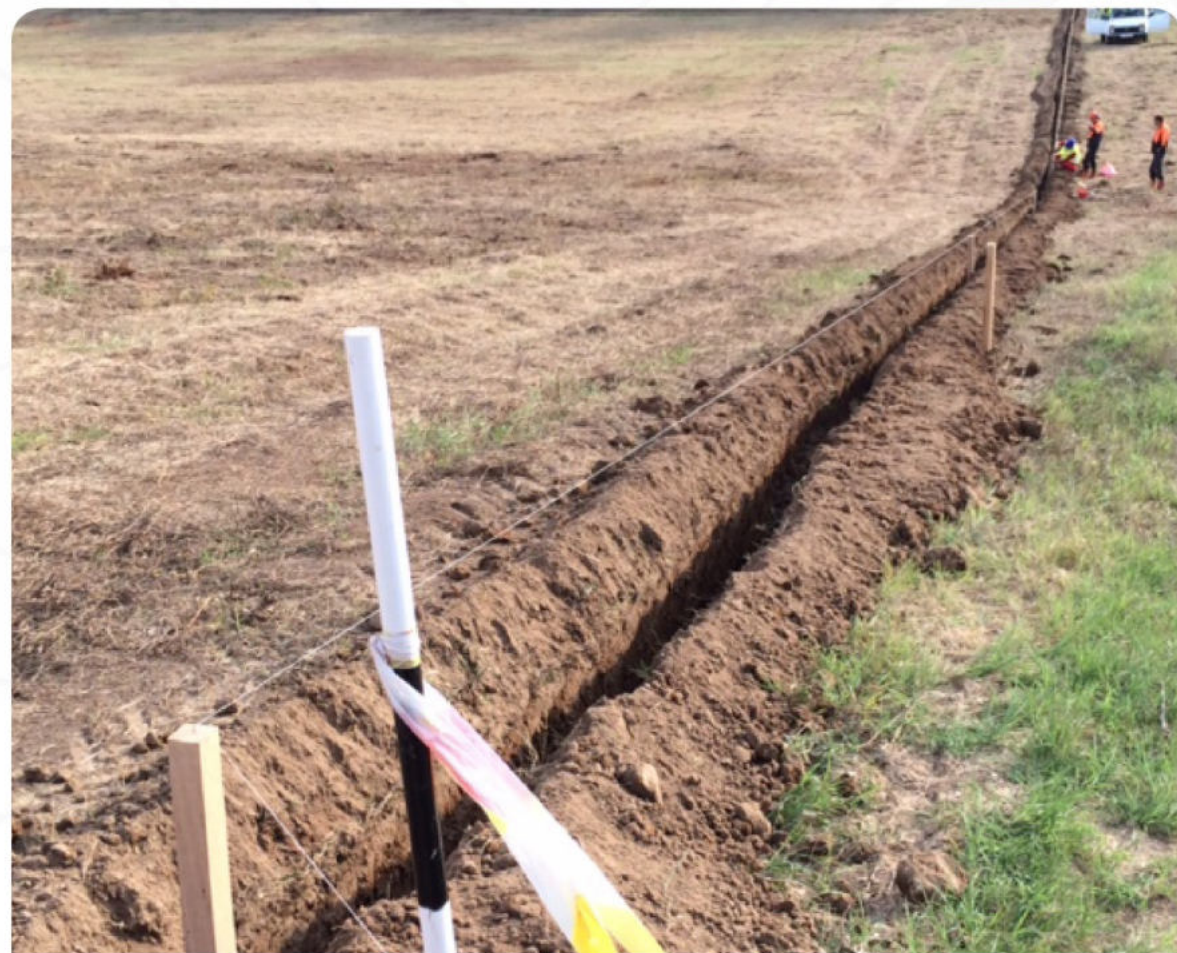
ПОДГОТОВКА ЗА ПОСТАВЯНЕ НА ВРЕМЕННА ОГРАДА ЗА СПАСЯВАНЕ НА ВЛЕЧУГИ

Нашият практически опит по подготвяне на терени за залесяване