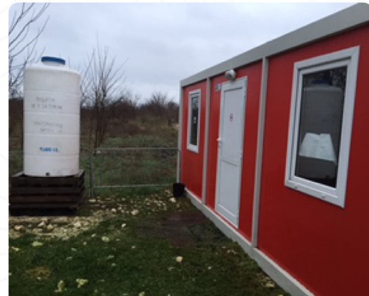
ИЗГРАЖДАНЕ НА БАЗОВ ЛАГЕР