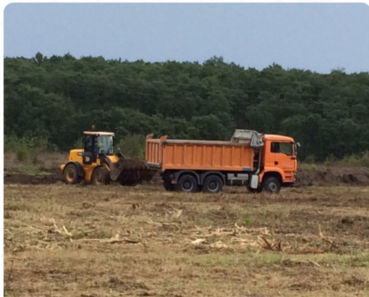
ИЗГРАЖДАНЕ НА ВРЕМЕННИ ПЪТИЩА В ГОРСКИ ТЕРЕНИ

Нашият практически опит по подготвяне на терени за залесяване