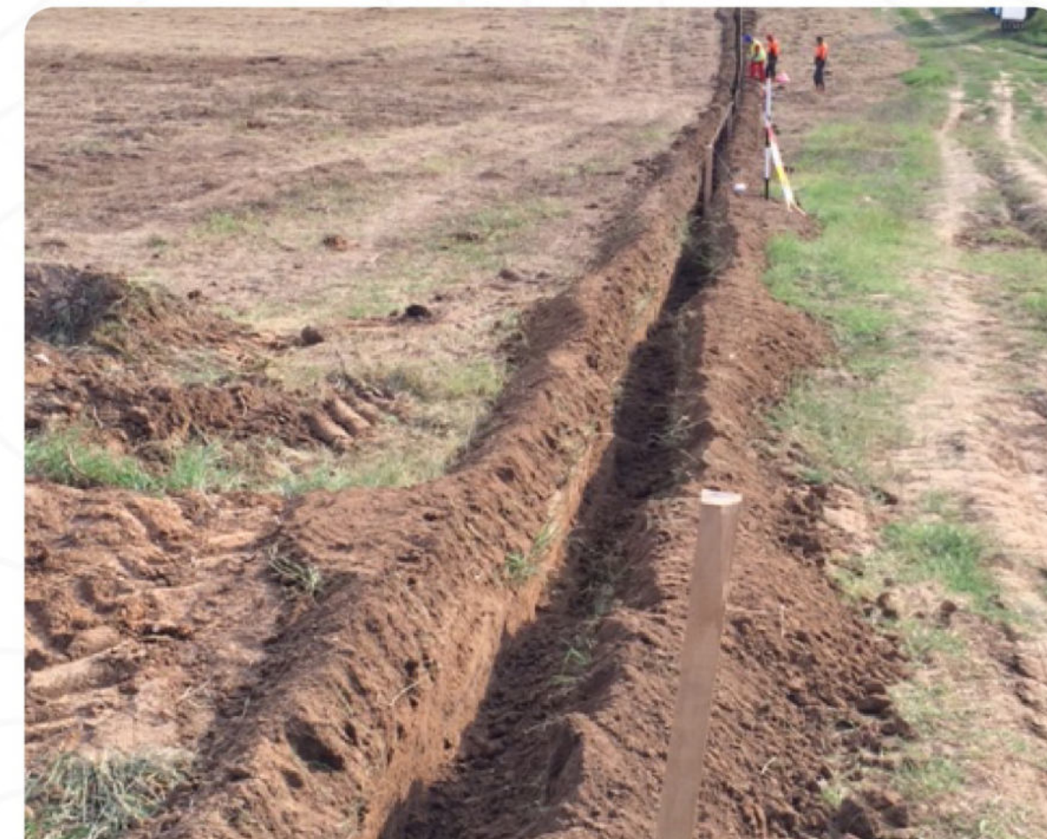
ПОДГОТОВКА ЗА ПОСТАВЯНЕ НА ВРЕМЕННА ОГРАДА ЗА ВЛЕЧУГИ