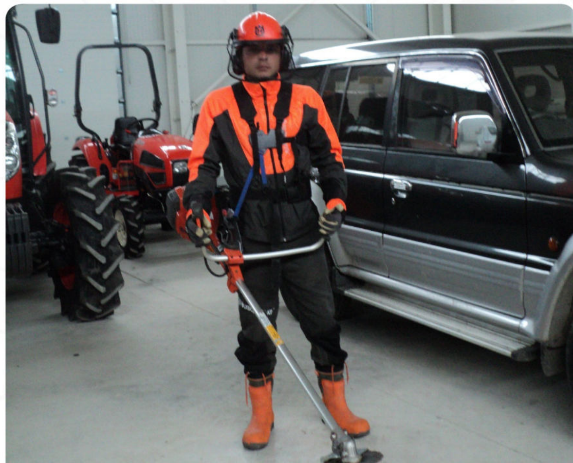
ЛПС ЗА РАБОТНИЦИ

Нашият практически опит по подготвяне на терени за залесяване