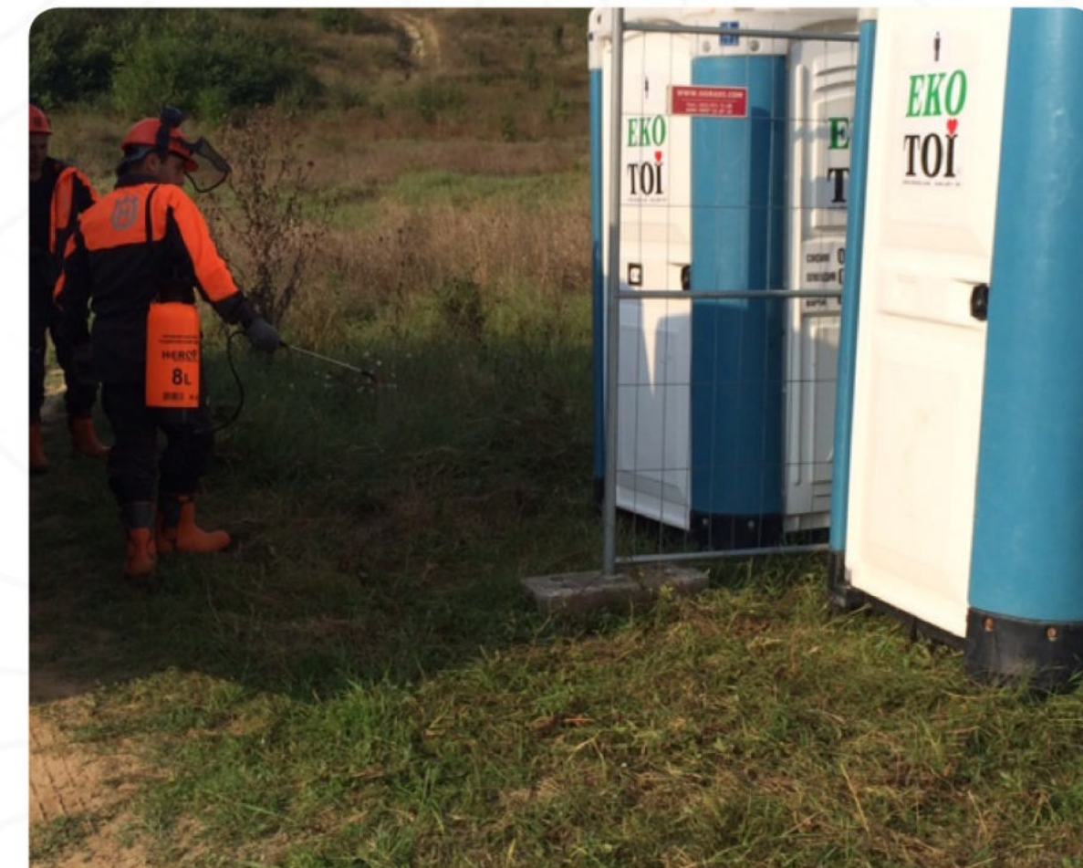
ПРЪСКАНЕ СРЕЩУ АКАРИ ПОЛЕВИ ЛАГЕР