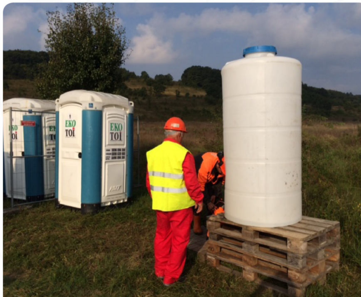
ИЗГРАЖДАНЕ НА ПОЛЕВИ ЛАГЕР