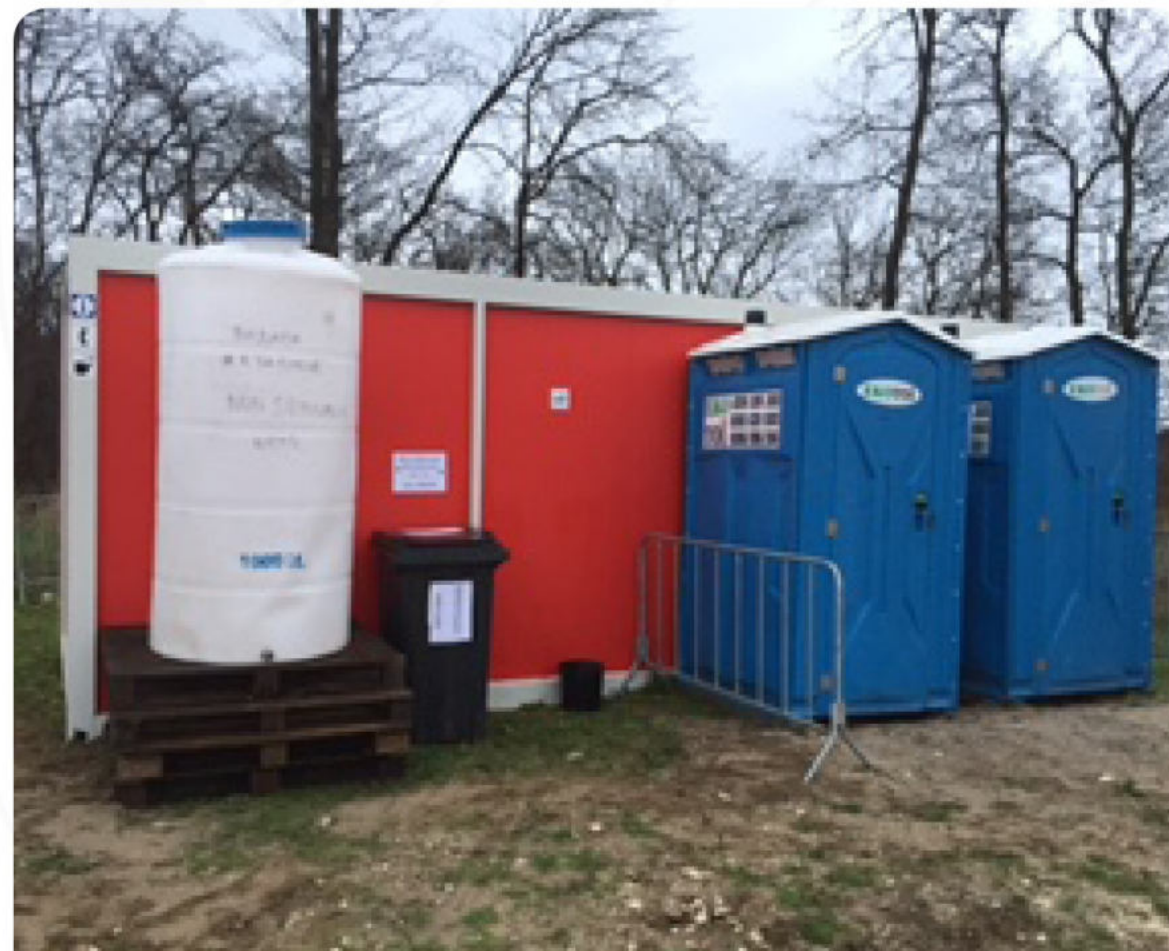
ИЗГРАЖДАНЕ НА БАЗОВ ЛАГЕР