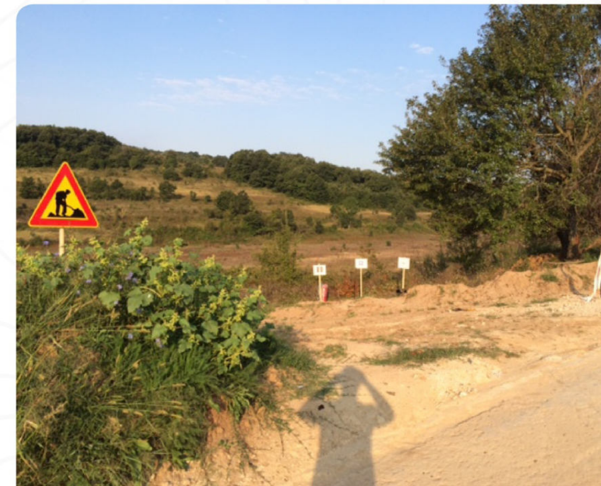
МАРКИРАНЕ НА РАБ. ПЛОЩАДКА