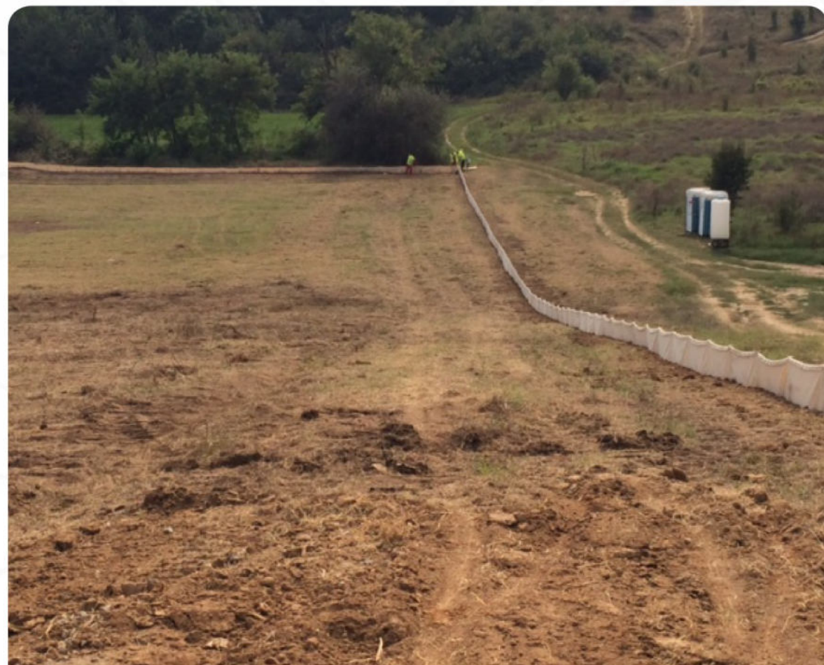
ПОСТАВЕНА ОГРАДА ЗА ВЛЕЧУГИ

Нашият практически опит по подготвяне на терени за залесяване