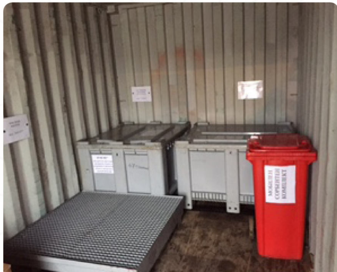
ПОЛЕВИ СКЛАД ЗА ОТПАДЪЦИ КЪМ БАЗОВ ЛАГЕР

Нашият практически опит по подготвяне на терени за залесяване