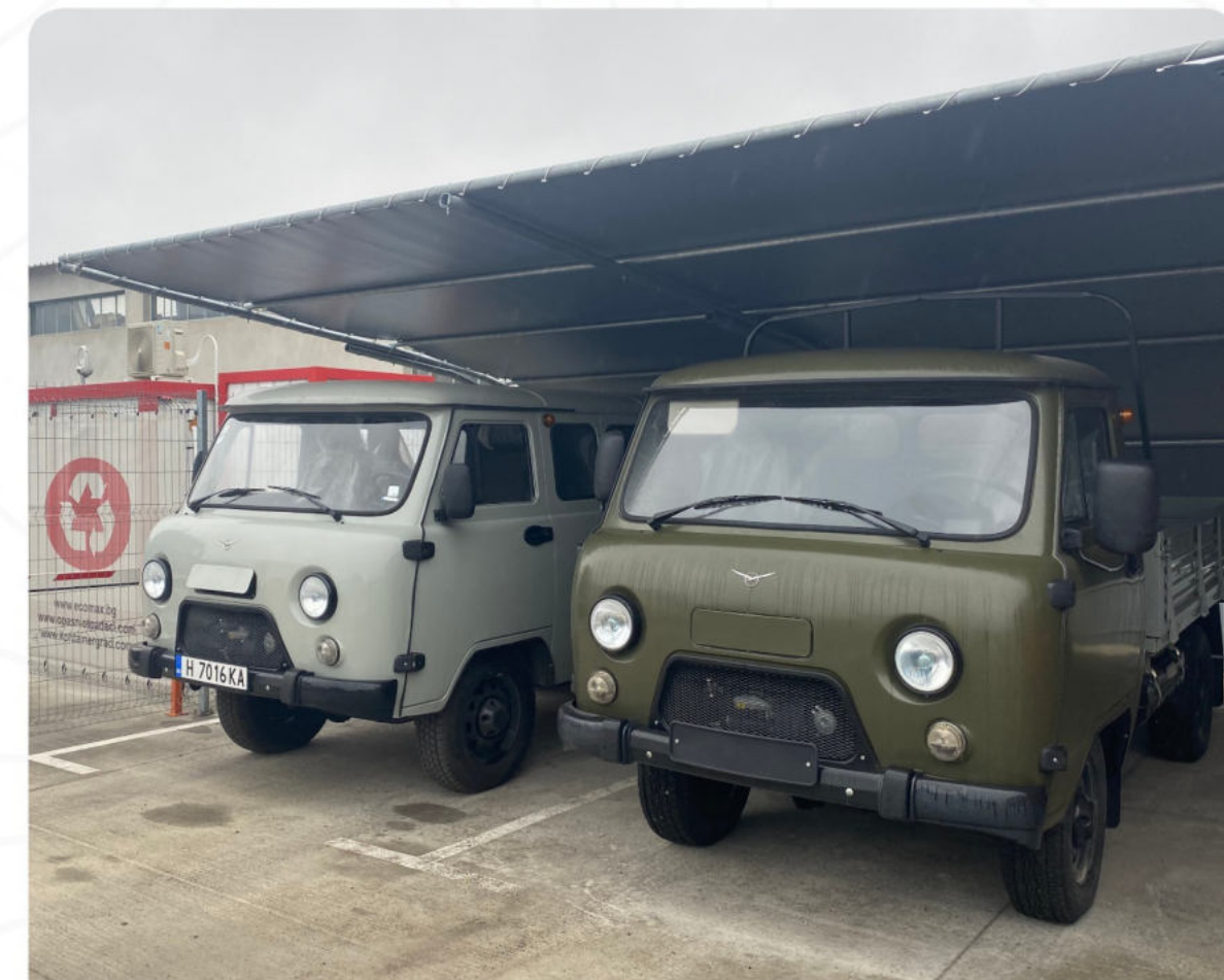
ТЕХНИКА НОВИ УАЗ-КИ