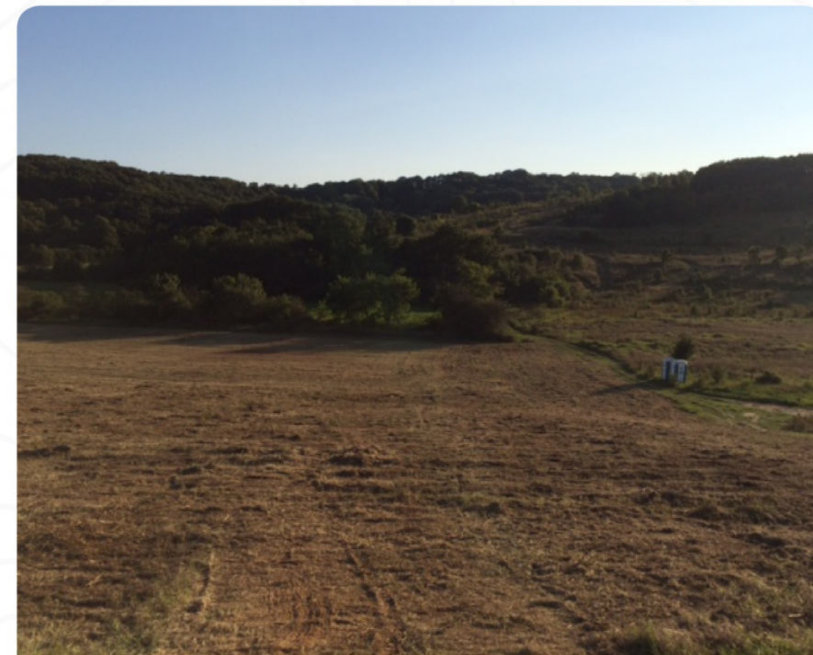
МУЛЧИРАН И ПОДГОТВЕН ТЕРЕН ЗА ЗАЛЕСЯВАНЕ