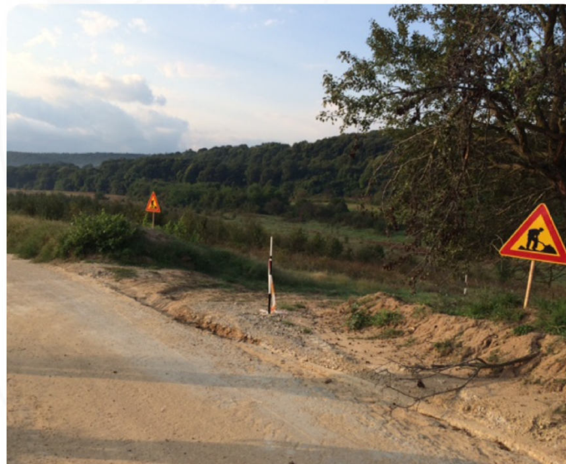
МАРКИРАНЕ НА РАБ. ПЛОЩАДКА