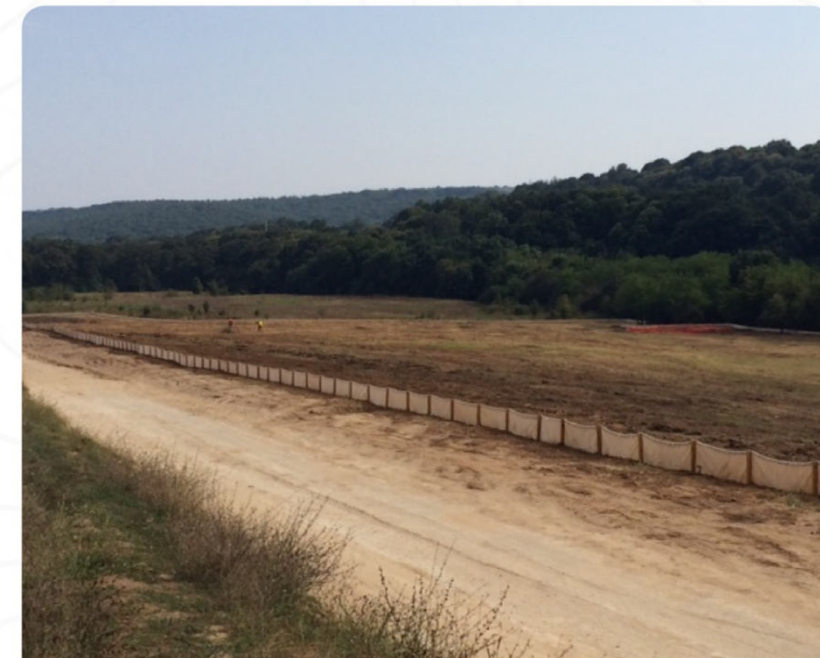
ПОСТАВЕНА ОГРАДА ЗА ВЛЕЧУГИ