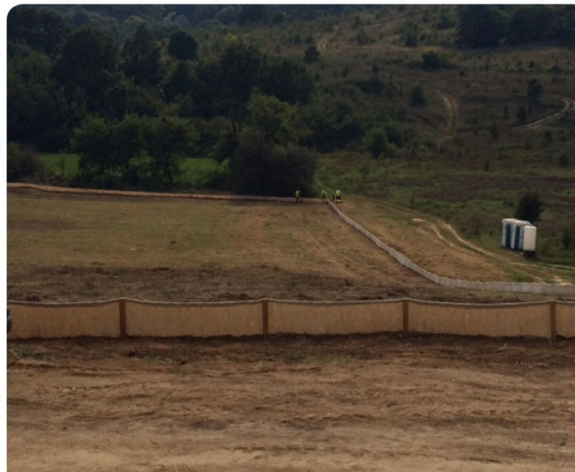
ПОСТАВЕНА ОГРАДА ЗА ВЛЕЧУГИ