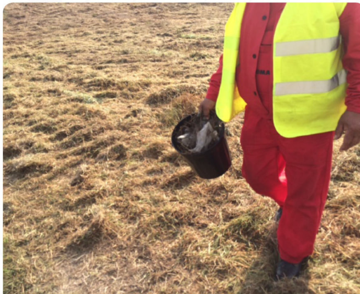
ОБОРКА НА ТЕРЕНА ПРЕДИ ЗАЛЕСЯВАНЕ