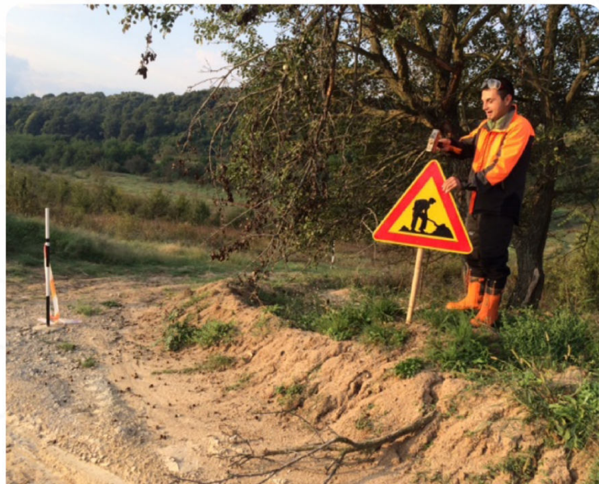
МАРКИРАНЕ НА РАБ. ПЛОЩАДКА

Нашият практически опит по подготвяне на терени за залесяване